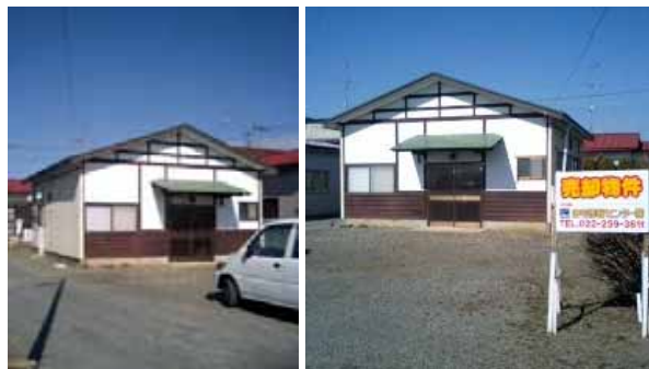
図面と現状が異なる場合は、現状を優先とさせていただきます。